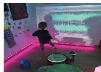
Spazio Terapeutico Synesthesia Room