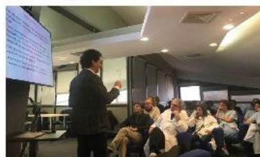
Formazione e Ricerca scientifica in Ospedale