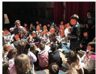
Attività per le scuole